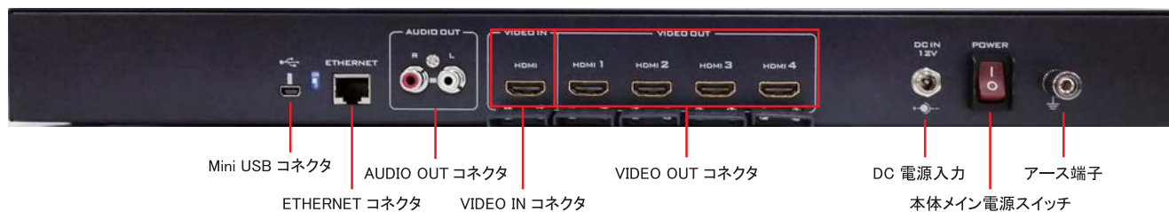
Mini USB コネクタ